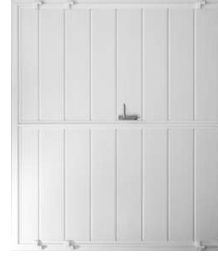
z. B. in Optik Mittelsicke