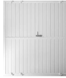
z. B. in Optik Sicke

Nebentüren auch in 2-flügeliger Ausführung!