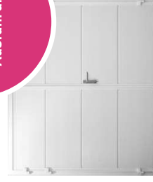
z. B. in Optik Ohne Sicke